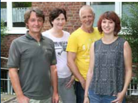
Team 2. Etage

Telefon 0221 96 286-21 E-Mail etage1@koelnerverein.de